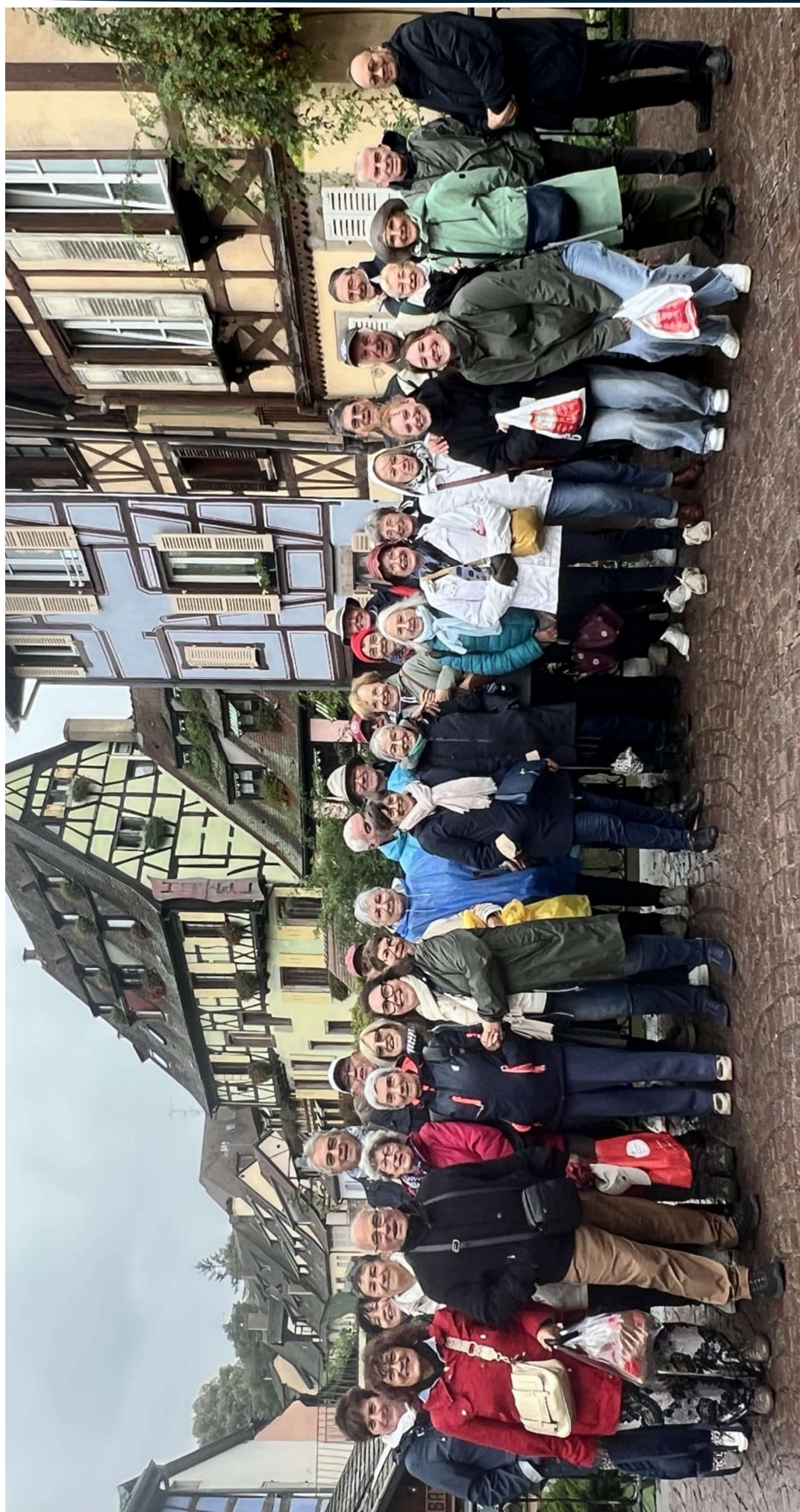
Proges95 a même attiré deux jeunes rouennaises conquises par la bonne ambiance du groupe!